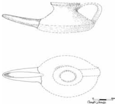
Fig. 5 – Apricena: Scavi archeologici in Piazza Federico II: ago per reti.