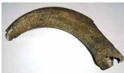
Fig. 8 – Apricena: Scavi archeologici in Piazza Federico II: corna di cervo.