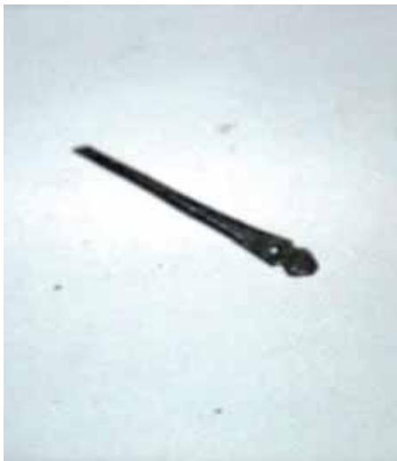
Fig. 4 – Apricena: Scavi archeologici in Piazza Federico II: rilevamento grafico di lucerna.