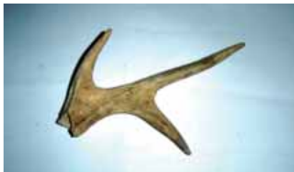
Fig. 6 – Apricena: Scavi archeologici in Piazza Federico II: corna di cervo.