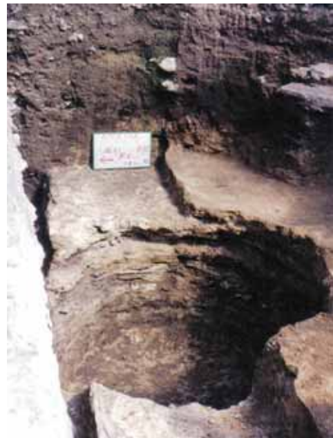
Fig. 2 – Apricena: Scavi archeologici in Piazza Federico II: fossa (F1).