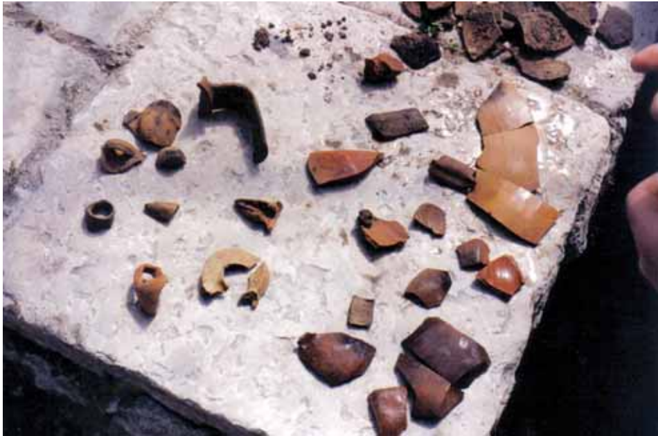
Fig. 3 – Apricena: Scavi archeologici in Piazza Federico II: reperti ceramici.