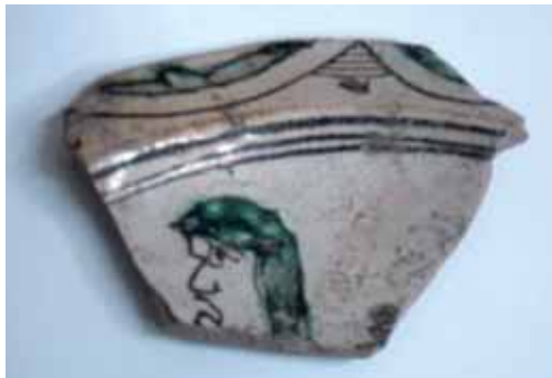
Fig. 11 – Apricena: Scavi archeologici in Piazza Federico II: frammento di piatto con decorazione policroma.