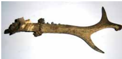
Fig. 7 – Apricena: Scavi archeologici in Piazza Federico II: corna di cervo.