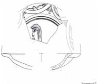
Fig. 10 – Apricena: Scavi archeologici in Piazza Federico II: rilevamento grafico del piatto con decorazione policroma.