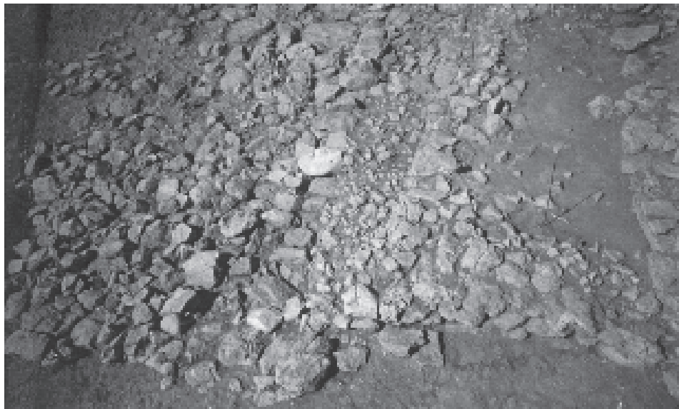
Fig. 2: Coppa Nevigata. Il tratto sud-occidentale del muro protoappenninico attualmente conservato, con gli allineamenti di pietre perpendicolari all'asse del muro stesso, visto da Sud-Est.