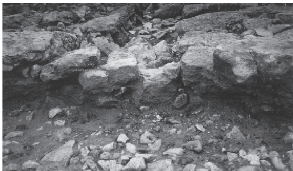
Fig. 3: Coppa Nevigata. Il tamponamento della postierla nord-orientale del muro protoappenninico.