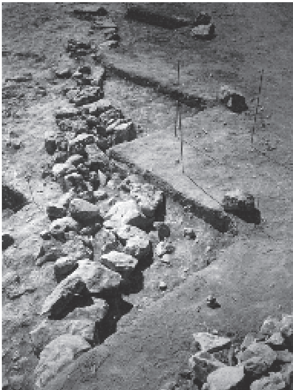
Fig. 4: Coppa Nevigata. Il muretto subparallelo alla fronte esterna del muro protoappenninico.