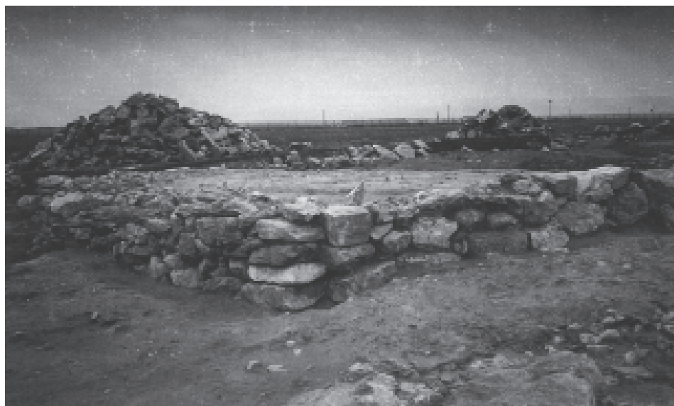
Fig. 6. Coppa Nevigata. La struttura nord-orientale dell'Appenninico Iniziale delimitata da un paramento in pietrame a secco e colmata con terreno misto a calcare giallastro frantumato.