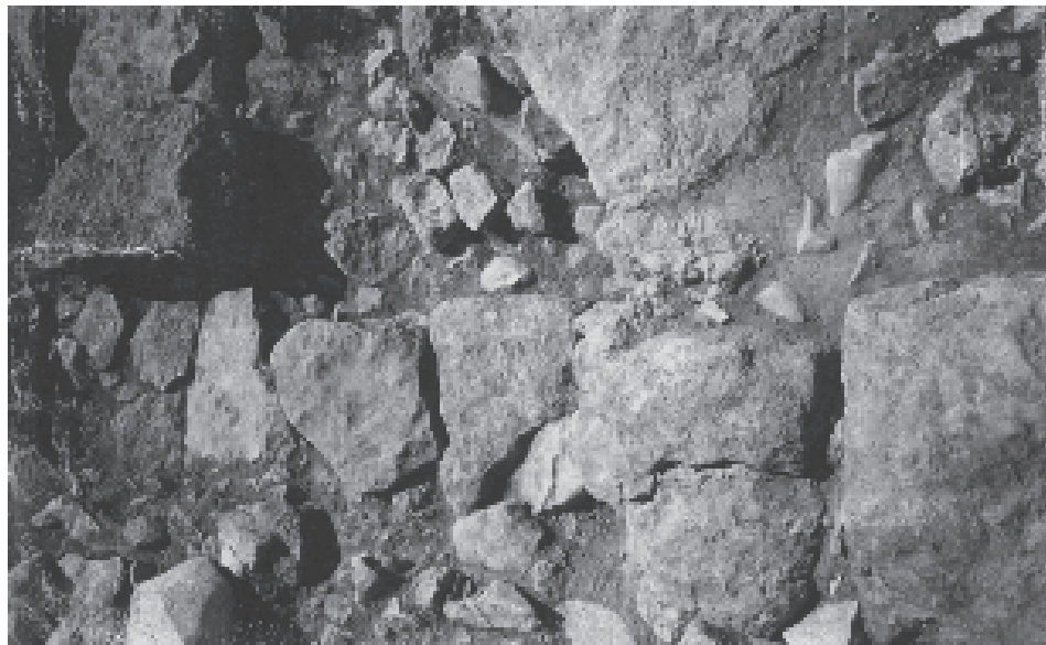
Fig. 5. Coppa Nevigata. Il tratto di fronte della torre occidentale che si raccorda al muro protoappenninico.